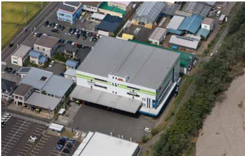
松本営業所・第8号倉庫

本店:長野県伊那市野底8268-17 TEL0265-72-4321 FAX0265-76-3200 URL http://www.ina-ootani.co.jp