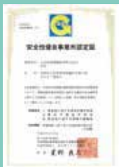
安全性評価事業(Gマーク)認定

営業所 伊那営業所:伊那市野底 南箕輪営業所:南箕輪村 飯田営業所:高森町下市田 松本営業所:松本市笹賀 長野営業所:長野市真島町 松本第2営業所:松本市笹賀 倉庫事業部:伊那市野底 松本倉庫部:松本市笹賀 飯田倉庫部:高森町下市田 関連会社 株式会社オオタニクレーン クレーン建方・設置工事 有限会社オオタニ計画 不動産売買仲介管理 店舗 開発 リフォーム工事 損害 保険代理店